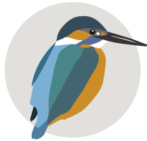
Det vilde 7080

Projektet er støttet af Vejle Kommune i forbindelse med byvision “Naturbyen - en byklynge ved Vejle Fjord” “Rotary Børkop støtter foredraget med Sebastian Klein”